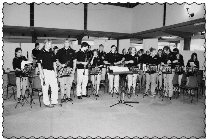
La Band "Kristal Lake"

Giornata indimenticabile quella del 2 Giugno 2007: primo perché viene celebrata la festa della Repubblica, secondo perché quest'anno la ricorrenza ha coinciso con la visita e l'esibizione della Crystal Lake Band e del Crystal Lake choir , provenienti da una scuola Statunitense dell'Illinois. All'organizzazione dell'evento ha ovviamente pensato soprattutto la Filarmonica Municipale "G. Puccini" di Sant'Anna, ma dobbiamo dire grazie anche all'Amministrazione Comunale e alla Società Operaia di Cascina. Il gruppo statunitense formato da un centinaio di ragazzi giovanissimi, accompagnati dai loro insegnanti e dai direttori della band e del coro, è giunto alle