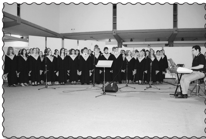
Il Coro "Kristal Lake"